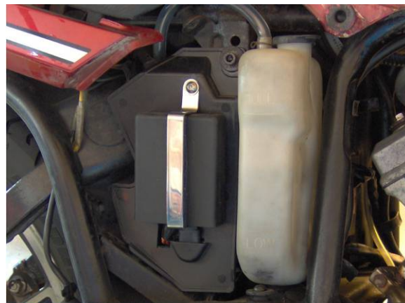
Montage mit einem Eigenbauhalter